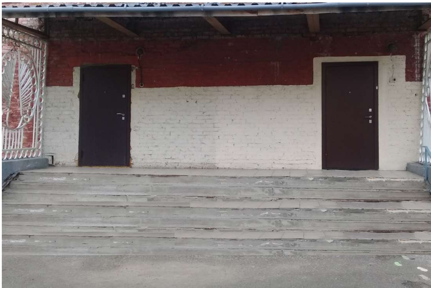
Фото 2 (Крыльцо 2)