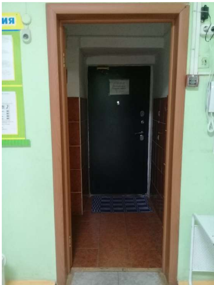
фото 4 Выход из здания