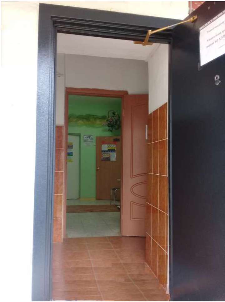
Фото 3 Вход в здание